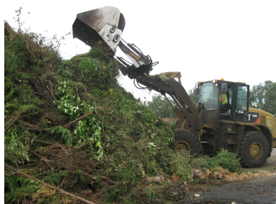
Dépôt des déchets verts

Chaque mercredi le personnel communal ramasse gratuitement les déchets verts des habitants du village pour ensuite les déposer sur le site de compostage géré par le groupe SUEZ ou les déchets verts seront transformés pour les agriculteurs. Cette initiative permet d'éviter que les particuliers les brûlent dans leur jardin. (Nuisances, pollution, écologie...)