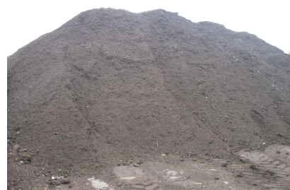
Compost prêt pour l'agriculture

→ L'économie d'énergie à l'école maternelle : pose d'un bardage bois isolant et double vitrage des menuiseries extérieurs ; éclairage par détection de présence et variateur d'intensité