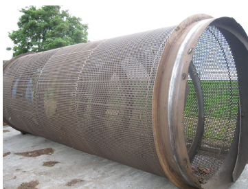
Tourelle du crible pour triage du compost