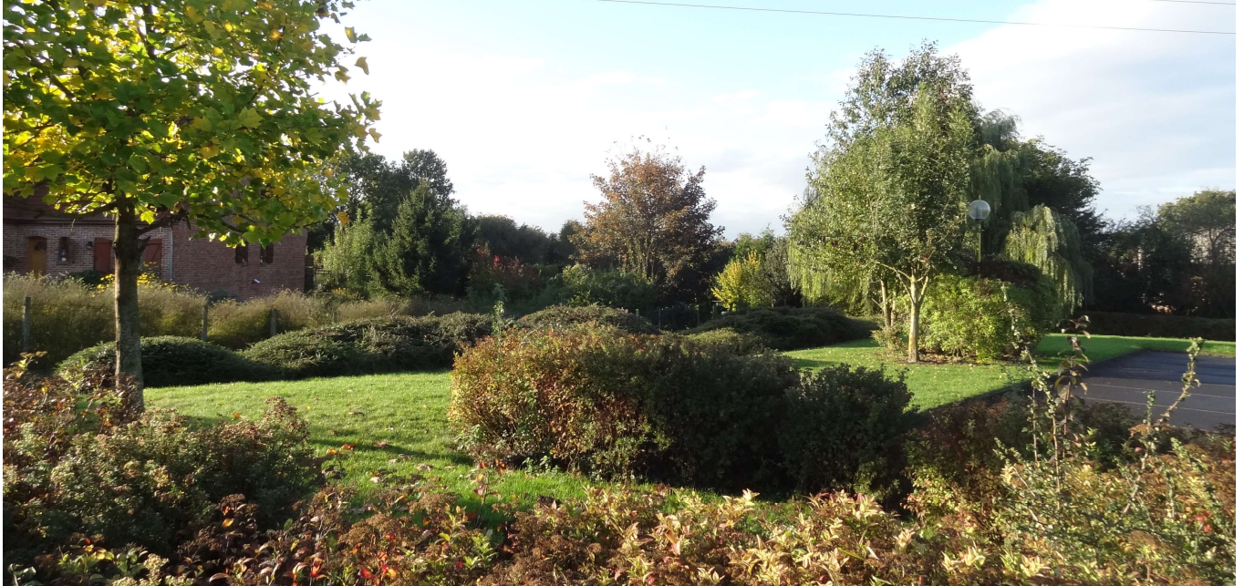
Ex : Les abords de la salle polyvalente illustrent la diversité des formes, des volumes

→ Des massifs arbustifs variés offrant des volumes contrastés :