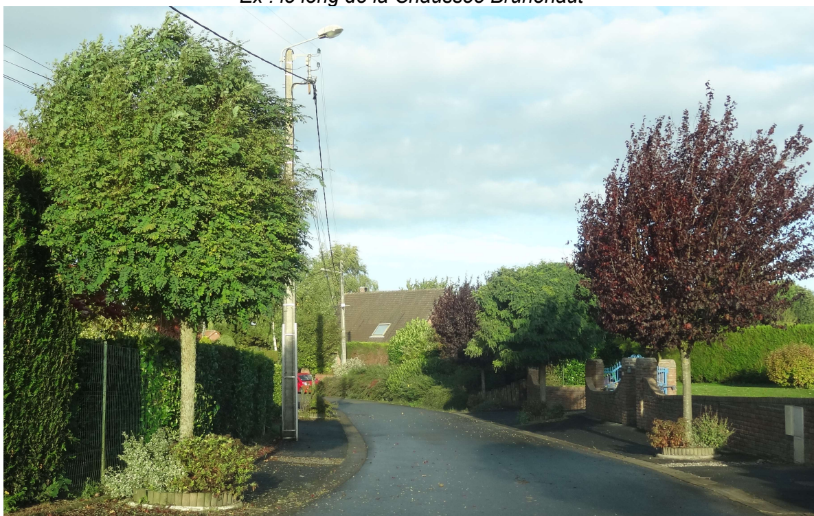
Ex : La rue Jacques Duclos