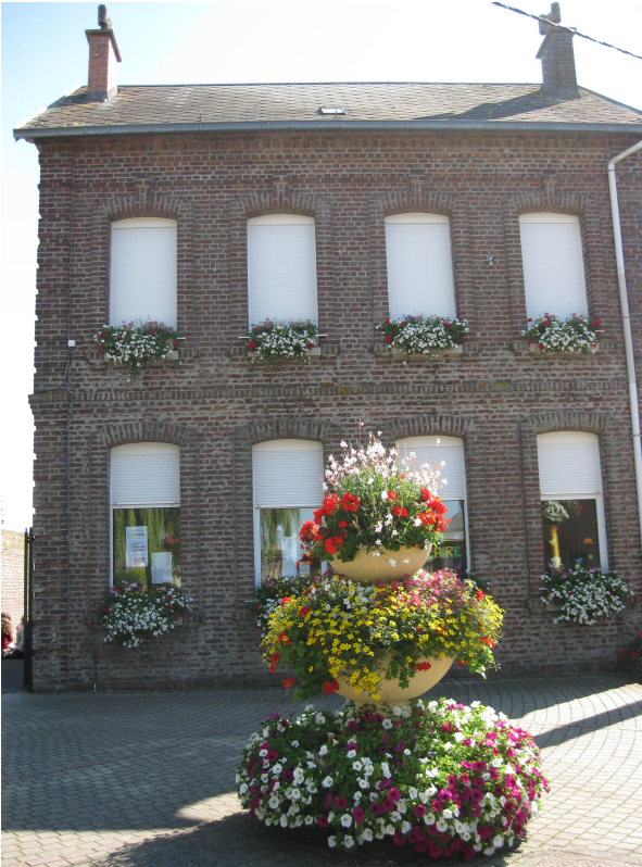
✓ la Place des écoles