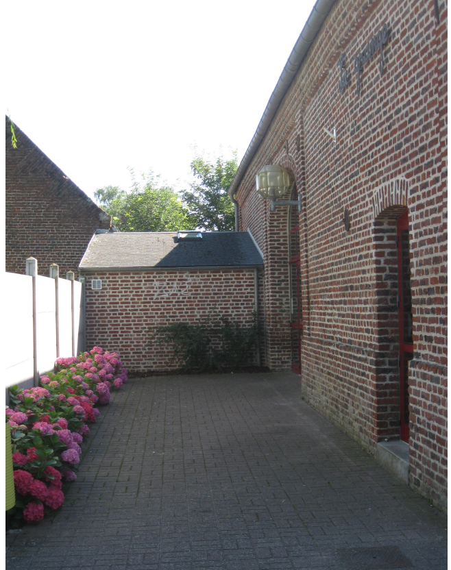
✓ la Salle d'activité « La Grange »