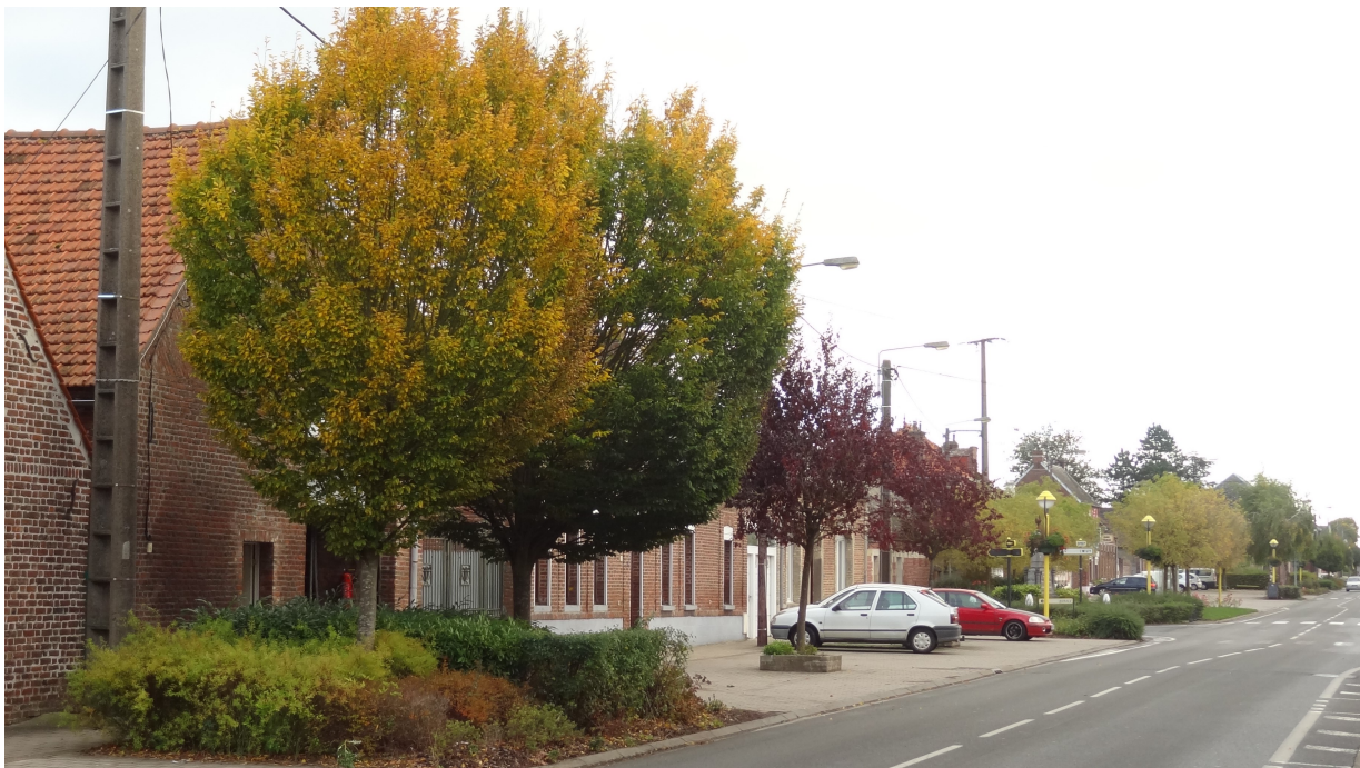
Ex : le long de la Chaussée Brunehaut

→ Une palette arborée relativement diversifiée :